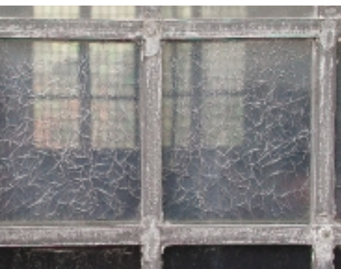
Dubbel beglaasd glas-in-lood met kunststof aan de buitenzijde. Door veroudering is de kunststof gecraqueleerd