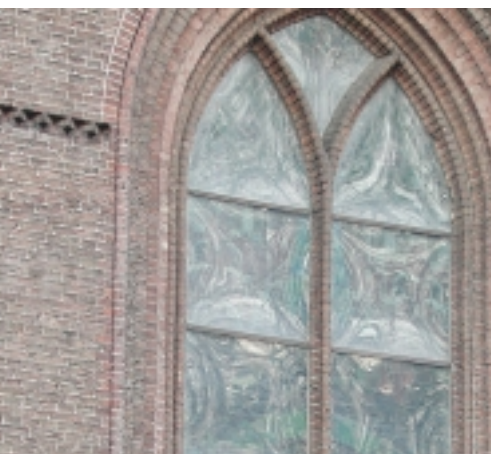
Een bescherming met kunststof. Doordat de kunststof sterk uitzet, vervormt hij en ontstaat er een vertekenende spiegeling, die een negatief effect heeft op het uiterlijk van de kerk