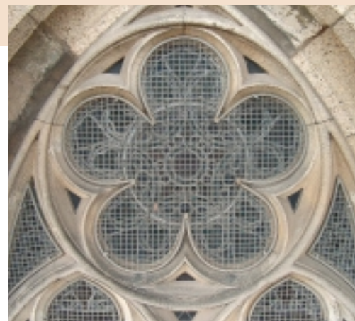
Eén van de raamkoppen van de St.-Jan in Den Bosch. Het glas-in-lood is hier beschermd met gaas