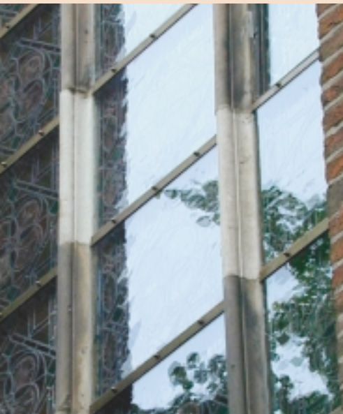
Voorzetbeglazing met mondgeblazen glas. Doordat dit glas enig reliëf bezit, is het spiegel-effect minder storend.