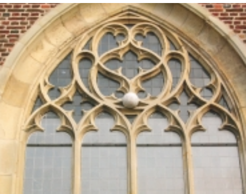
Bescherming tegen vandalisme. Het beschermende systeem stopt bij de tracering en er is getracht het glas juist daar kapot te krijgen. Dat de bal is blijven steken in de tracering geeft de kracht aan waarmee hij tegen het raam is geschopt