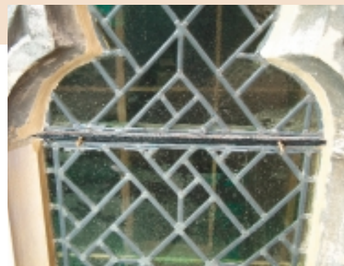
Wanneer een brugstaaf met een T-profiel wordt gehandhaafd, worden hierop stukken draadeind gelast voor het bevestigen van het beschermglas

De spouw tussen de twee beglazingen moet voor een goede ventilatie ter plaatse van de brugstaven minimaal twee centimeter diep zijn. Ventilatie is niet alleen nodig om vocht uit de spouw te weren, maar ook om stof en spinrag te voorkomen. Spinnen nestelen zich niet op plekken waar het tocht. Om een goede schoorsteenwerking te krijgen is een doorlopende spouw van onder naar boven van belang en moeten de voorzetramen aan de zijkanten goed sluiten. Aan de onder- en bovenkant dient de doorgaande in- en uitstroombopening circa de helft van de spouwbreedte te beslaan. De zijkanten worden dichtgekit met een zuurvrije kit.