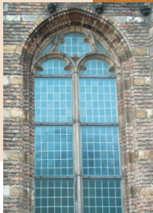
Glas-in-lood beschermd met een voorzet- beglazing van gestructureerd glas. Dit glas kent vrijwel geen spiegeling

Glas-in-lood raakt regelmatig beschadigd. In veel gevallen wordt er daarom gegrepen naar beschermende constructies. Soms leiden die door onwetendheid tot meer schade. Via deze brochure brengt de Rijksdienst voor de Monumentenzorg verschillende beschermende maatregelen onder de aandacht. Lees voor meer informatie over de soorten schade onze brochure Aantasting van gebrandschilderd glas en glas-in-lood, Info Restauratie en beheer 31 . Een volgende brochure zal ingaan op herstelmethoden en onderhoud van glas-in-lood.